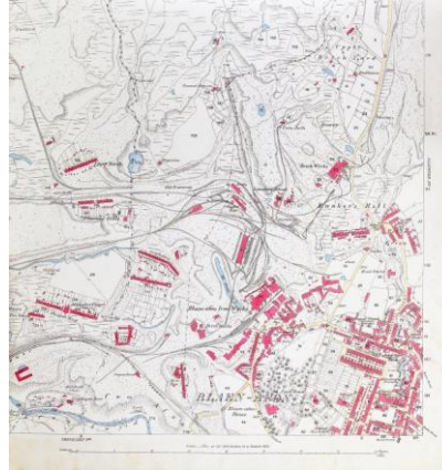
Map Arolwg Ordnans argraffiad cyntaf, 1881.