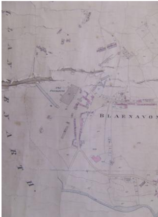
Blaenavon Tithe Map

Mae'r ddau fap isod yn dangos map degwm (dyddiedig 1844) ac argraffiad cyntaf o fap Arolwg Ordnans (a gyhoeddwyd ym 1881). Cafodd y ddau fap hyn eu creu am resymau gwahanol iawn.