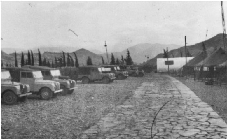
Hen ffotograff o wersyll catrawd Cymreig yn Lefke yng Nghyprus, mewn lleoliad a elwir yn 'wersyll Aberdeen'.

Ar adegau, yn enwedig wrth fod ar batrôl, ychydig o gig a bara oedd y bwyd, gyda sachet o halen a gedwid ym mhocedi'r milwyr, i ychwanegu rhywfaint o flas. Gwnaeth Vyron ddefnydd da o ffreutur NAAFI, a oedd yn y gwersyll. Gellid cael pryd o fwyd dda yn y NAAFI.