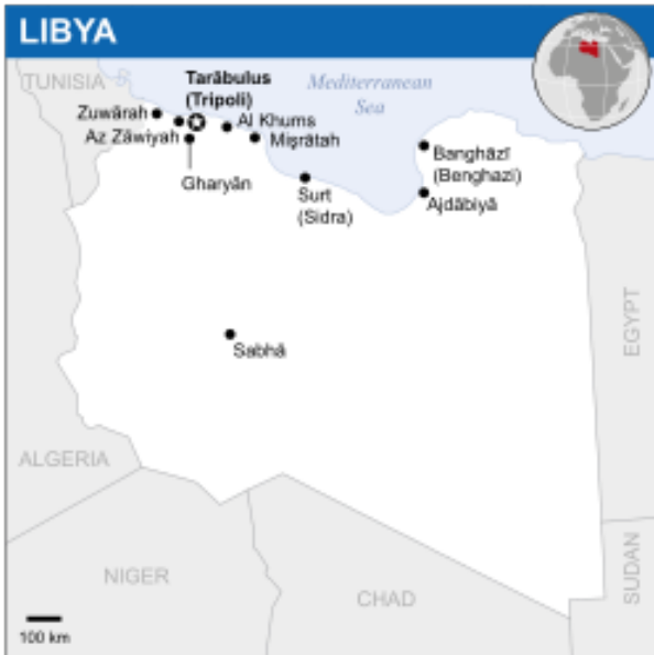
Map o Libya, gyda Benghazi wedi'i leoli ar y dde eithaf. Sefydlodd y Gatrawd Gymreig bencadlys yma ym 1959.

Derbyniwyd yn gyffredinol fod y bataliwn wedi perfformio'n dda yn ystod ei gyfnod ar ddyletswydd yng Nghyprus. Fodd bynnag, nid oedd unrhyw ddychweliad adref i fod. Yn lle hynny, roedd Brydain angen 'esgidiau ar y lawr' i gefnogi ei hamcanion yn Libya ac i gynnal cysylltiadau cyfeillgar â gwlad a oedd yn gynyddol gyfoethog mewn olew. Felly, roedd taith 'cadw heddwch' arall mewn amgylchedd poeth a llwchlyd o'n blaenau i'r milwyr Cymreig. Byddai Libya yn llawer poethach a llwchlydach na Cyprus. Roedd Vyron a'i gymdeithion wedi'u tynghedu i ddioddef ychydig fisoedd caled yn yr anialwch.