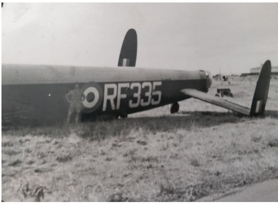
Ernie yn sefyll wrth ymyl bomiwr Avro Lincoln arol damwain.

Wnaeth yr adran Dân yr RAF defnyddio dendrau wedi'u cynllunio'n arbennig, a oedd yn defnyddio gwrth-dân ewyn, yn hytrach na'r cymysgedd dŵr a CO2 roedd yn cael eu defnyddio gan dendrau sifil. Cafodd y cymysgedd ewyn ei daflu allan ar gyflymder uchel i ffurfio blanced dros yr awyren, a oedd yn amddifadu'r tân o ocsigen. Roedd y dull hwn yn cynnwys, yn atal ac yn diffodd y fflamau.