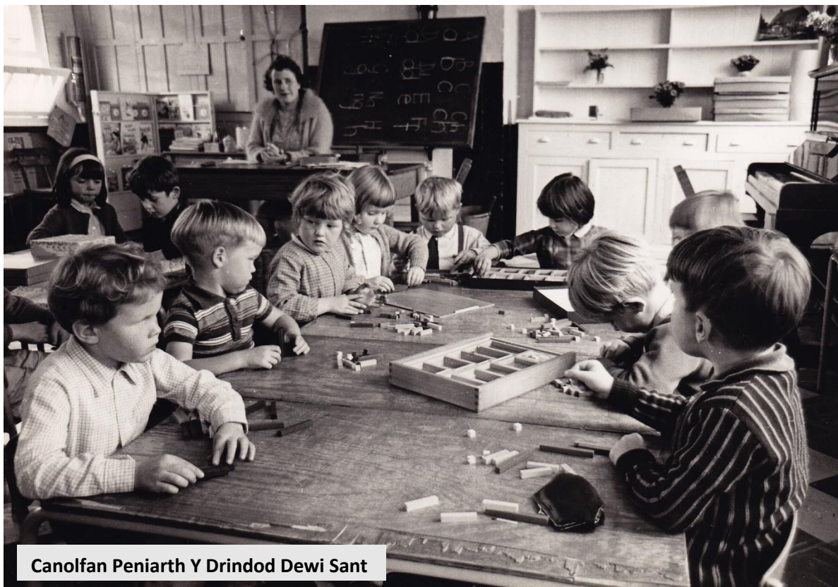
Canolfan Peniarth Y Drindod Dewi Sant

[Wedi'i addasu o Julie Heathcote, Memories are made of this: Reminiscence activities for person-centred care (Llundain: Cymdeithas Alzheimer's, 2009).]