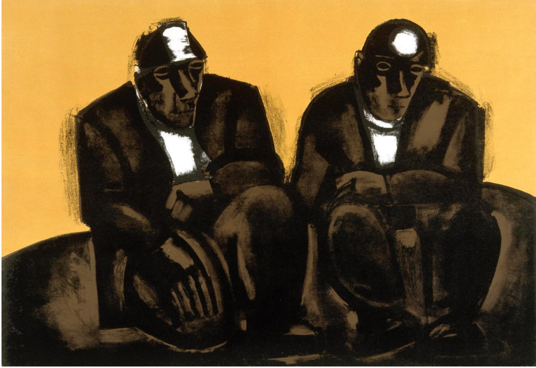
Two Miners gan Josef Herman (1911-2000).