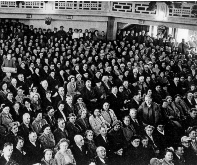
Eisteddfod y Glowyr, Porthcawl, 1957