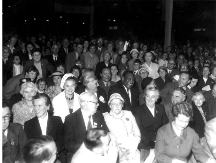
National Eisteddfod Ebbw Vale with A Bevan, 1958

Ym mis Gorffennaf 1958 cafodd Paul Robeson a'i wraig Eslanda eu pasbortau yn ôl. Cafodd y Robesons groeso rhyfeddol ym Mhrydain a ledled Ewrop.