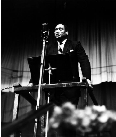
Yr Eisteddfod, Glyn Ebwy, 1958