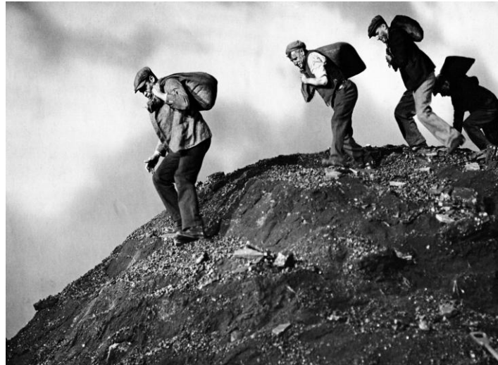
Proud Valley, 1940

Mewn teyrnged can mlwyddiant i Paul Robeson a gynhaliwyd yn Efrog Newydd, yn Neuadd Carnegie, yn 1998, gwnaeth yr actorion Whoopi Goldberg ac Ossie Davies ddwyn stori i gof am gyswllt cyntaf Robeson â'r Cymry yn Llundain: