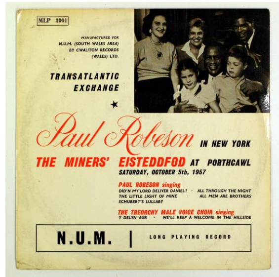
Clawr record y Cyfnewid Traws-Iwerydd, Porthcawl

Technoleg newydd y cyfnod oedd y gallu i ddefnyddio'r ffôn ar gyfer galwadau ar draws Môr Iwerydd rhwng Prydain ac Unol Daleithiau America.